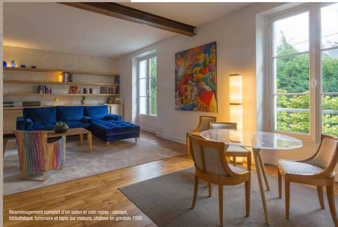
Réaménagement complet d'un salon et coin repas : canapé, bibliothèque, luminaire et tapis sur mesure, chaises en gondole 1930