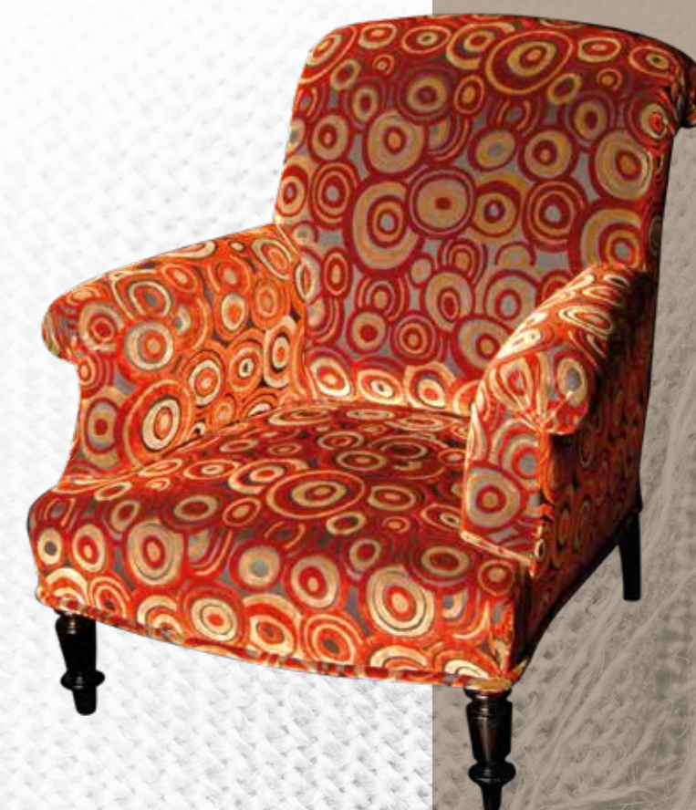
Fauteuil Anglais à crosse, velours de soie Art-déco