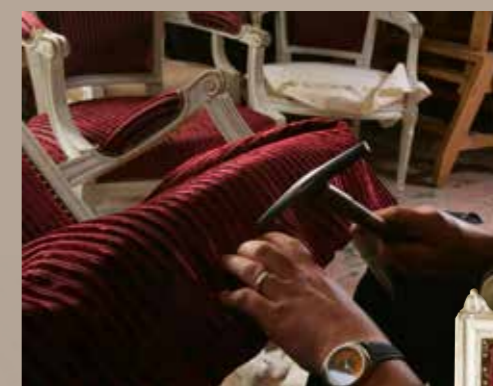
Étapes de garniture traditionnelle d'un fauteuil Louis XVI