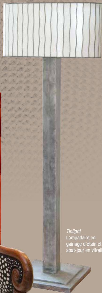
Tinlight Lampadaire en gainage d'étain et abat-jour en vitrail