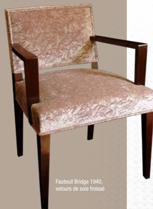
Fauteuil Bridge 1940, velours de soie froissé