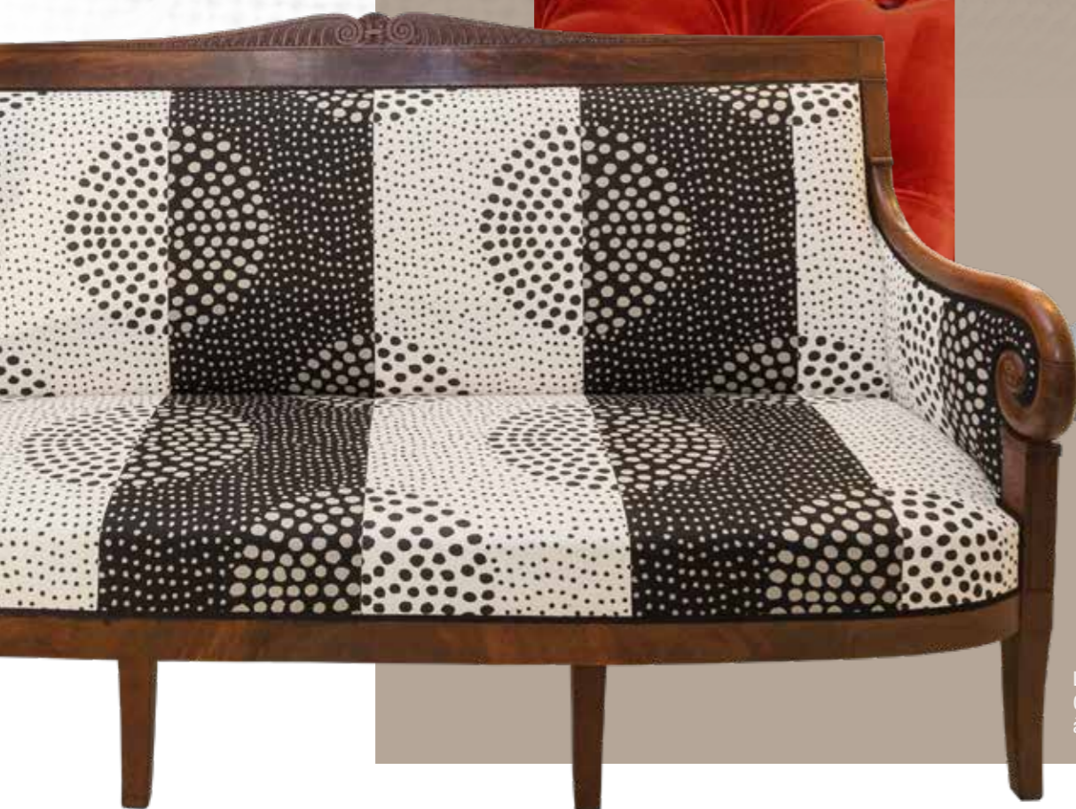
Lin imprimé pour un Canapé « Restauration » à l'allure contemporaine